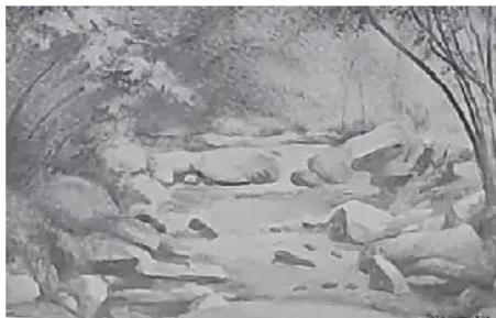
Torrente a Lurisia 1986