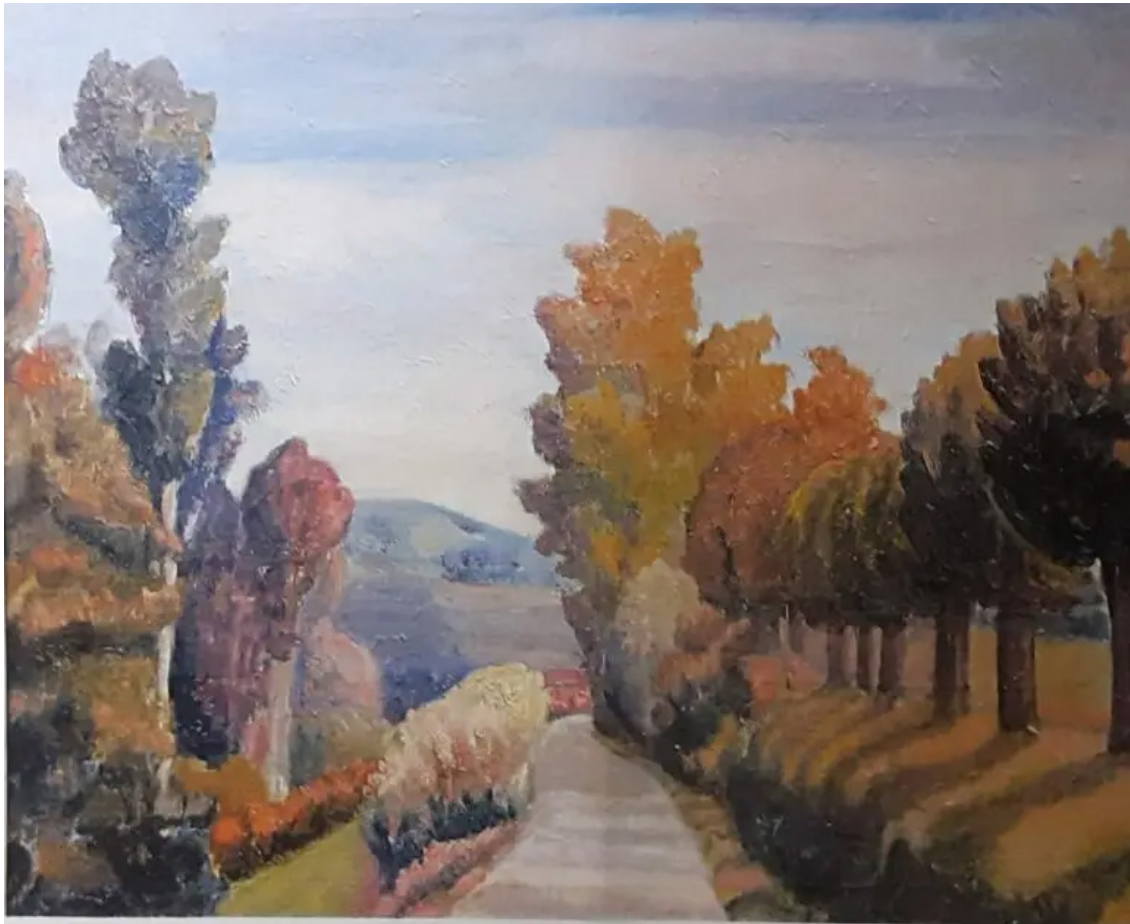
Mario Borio. Paesaggio dell'astigiano (1940).