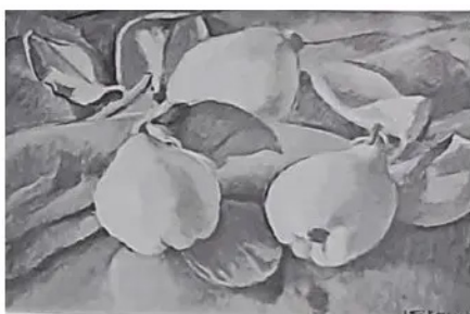
STANCHI. Mele cotogne olio su tela 1979

Ottimista, idealista a trazione pseudo-progressiste, nonostante il successo non ha mai pensato alla fama a dedicarsi esclusivamente alla pittura, perché aveva un'altra grande passione, molto comune tra i valenzani: l'oreficeria.